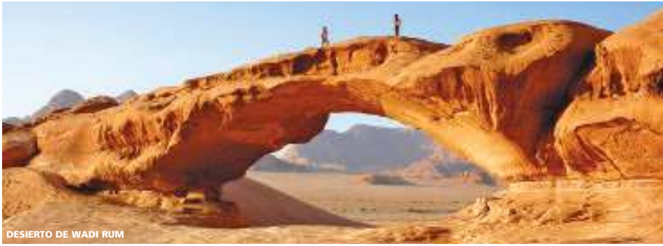
DESIERTO DE WADI RUM

8 días (7 noches de hotel) desde 820 USD