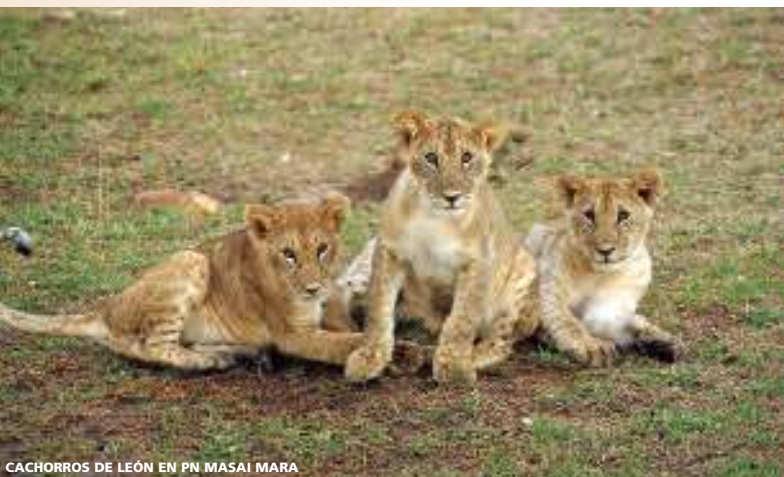
CACHORROS DE LEÓN EN PN MASAI MARA